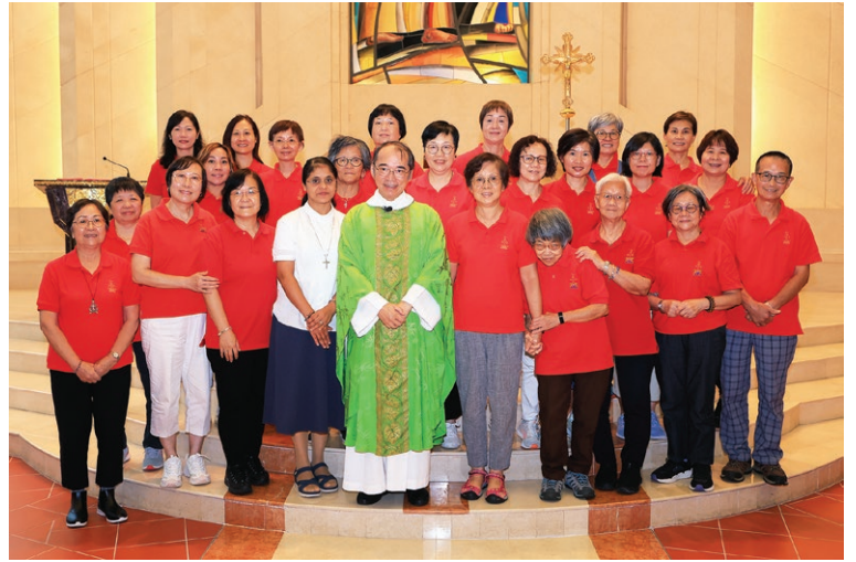
7月27日聯絡員承諾禮