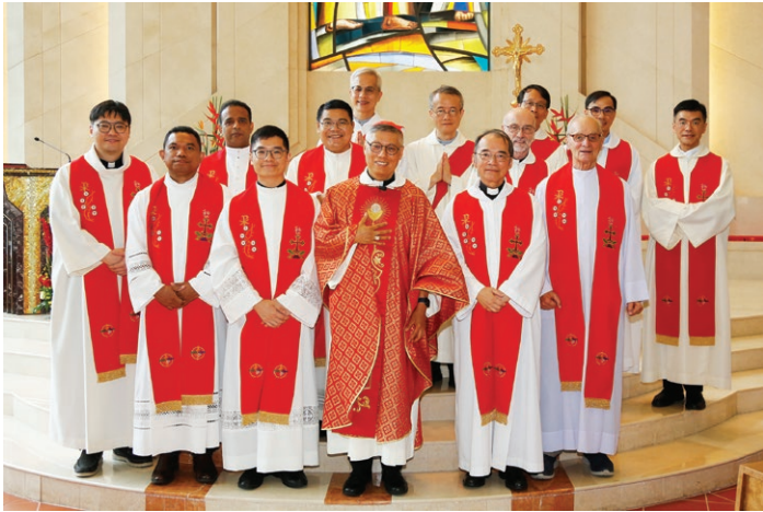
6月30日主保瞻禮彌撒