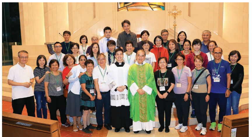
9月28日慕道班導師派遣禮