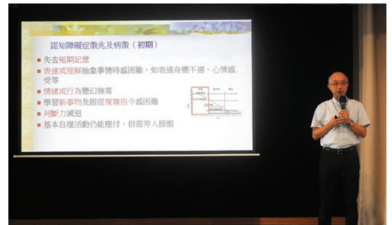
10月6日認識腦退化症