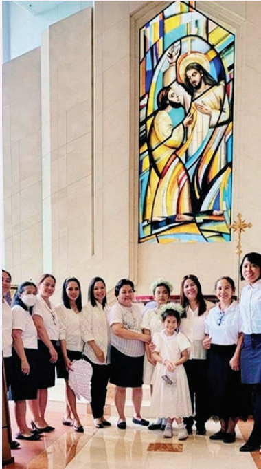
The Rosary Gathering

This is a yearly event celebrated every October, highlighting the four Mysteries of the Holy Rosary of our Blessed Mother Mary. This year, we celebrated on October 27, 2024. The celebration includes praying of the Four Mysteries of the Holy Rosary, namely Joyful, Luminous, Sorrowful and Glorious, the crowning of our Blessed Mother Mary as the Queen of Heaven and Earth, and the Marian Dance, offered to Mama Mary for her immeasurable love for us, her beloved children.