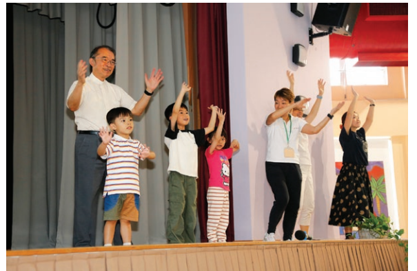
7月28日「喜樂泉源」工作坊