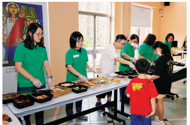
9月15日愛心飯局迎中秋